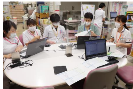
病棟NSTカンファレンスの様子

NSTカンファレンスでは、介入依頼のある患者さんの栄養評価(摂取栄養量の評価、Inbody計測による体組成評価、生化学データなど)を行い、その結果を踏まえ、治療方針に沿って多職種で栄養療法に関する提案をしています。管理栄養士は、患者さんのベッドサイドに伺い、食事内容の調整や栄養評価結果の説明を行っています。