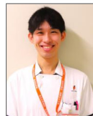
文責: 田口雄也 (栄養管理室)