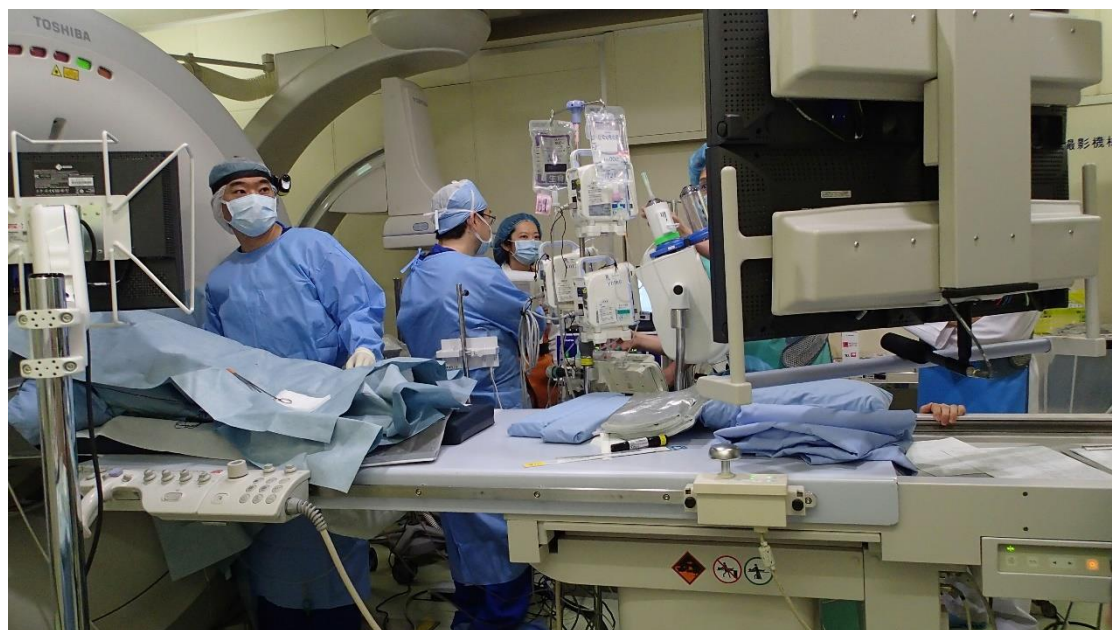
図2 治療の様子。CT透視下で治療を行う。