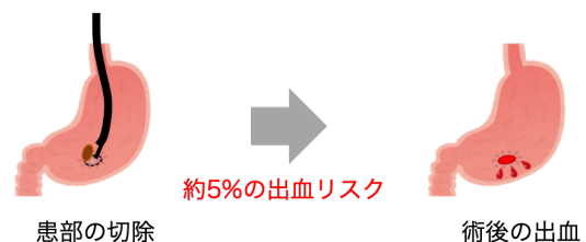
早期胃癌内視鏡治療後の出血予測モデルを開発

本研究成果は、日本時間2020年6月5日午前10時 Gut 誌（電子版）に掲載されます。