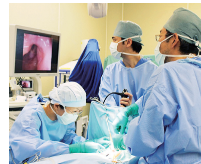
声帯麻痺に対する喉頭枠組み手術

当科では耳鼻咽喉・頭頸部外科の全ての分野で全国でも最先端の医療・研究を、熱意を持って行っていると自負しています。私どもが力になれるような患者さんがいらっしゃいましたら、ぜひ当科までご紹介をお願い申し上げます。