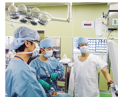
内視鏡下鼻副鼻腔手術